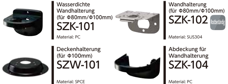
Wasserdichte Wandhalterung (für \Phi 80\text{mm}/\Phi 100\text{mm} ) SKZ-101 Material: PC