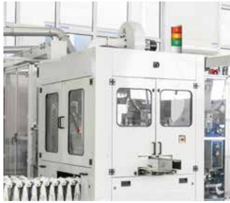
Statusbenachrichtigung für Schaltschränke und industrielle Maschinen