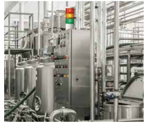
IP69K-konform. Ideal für Lebensmittel- und Pharmabetriebe