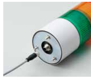
M12-Stecker Reduziert die Installations- und Austauschzeit.