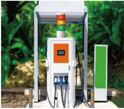
Alarmierung im Außenbereich